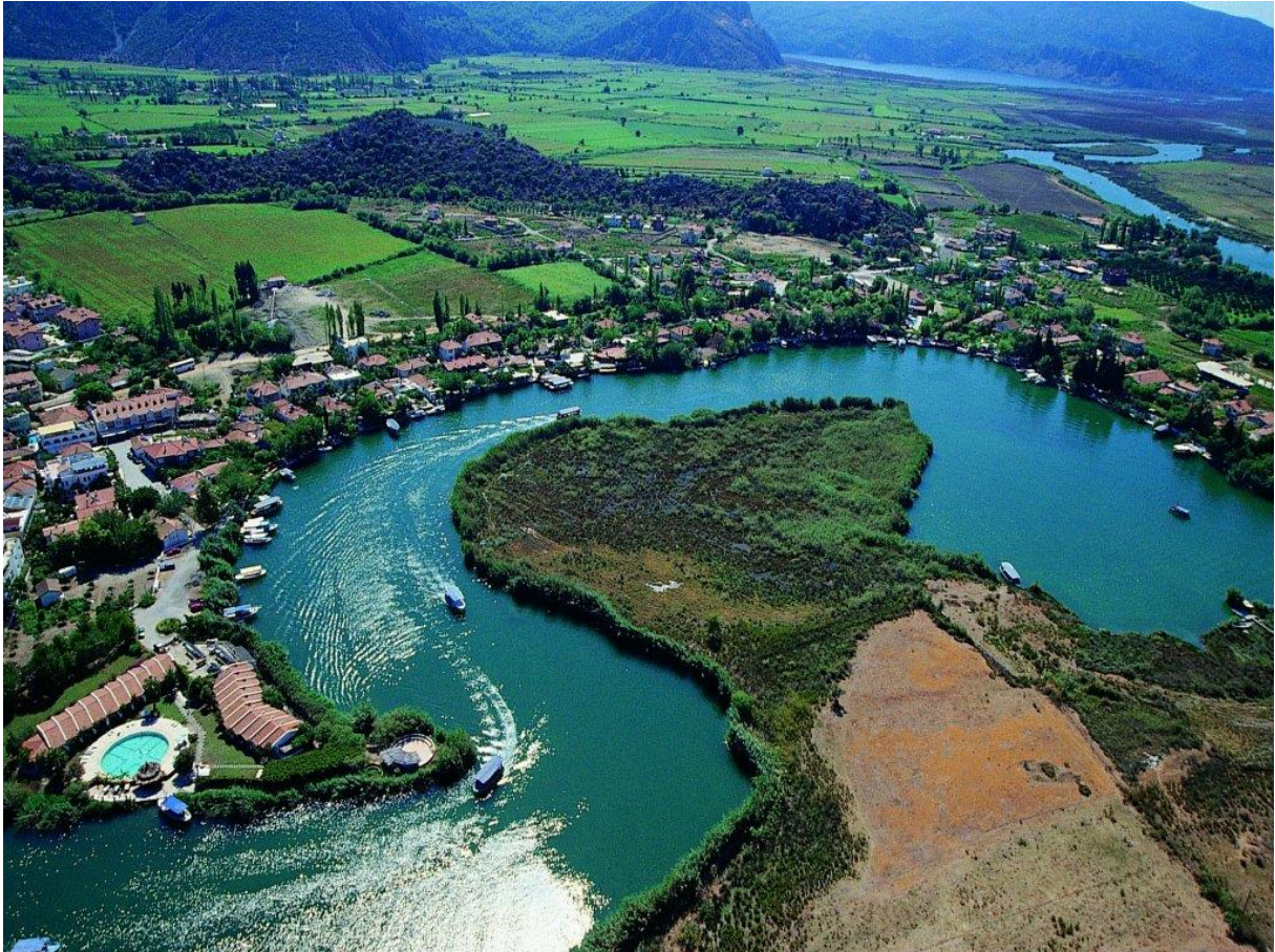
Датча – Винодельня (Wine yard)